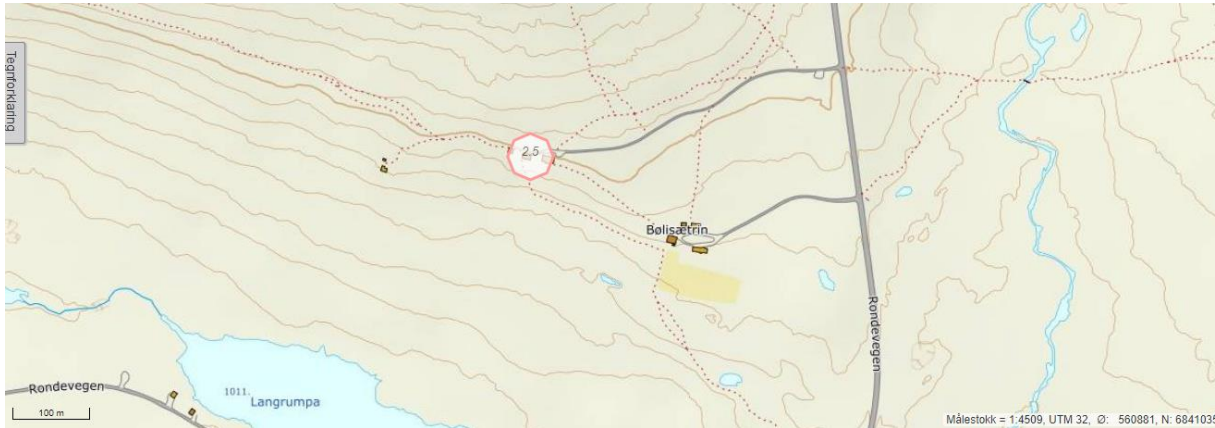
Kart 2. Oversiktskart som viser plasseringen til Bølhøgda seter (194/1/53), i hvitt innenfor rød ring.

Kart 2 nedenfor viser plasseringen til Bølhøgda seter, vest for FV27 over Venabygdsfjellet og sør for Søre Bølhøgda. Vedlegg 2 viser en kartutskrift hvor det fremgår at det ikke er opparbeidet noen seterkrve på setra. Dette ble også konstatert på befaring på setra 24. juli 2020, hvor daglig leder og styreleder i fjellstyret deltok.